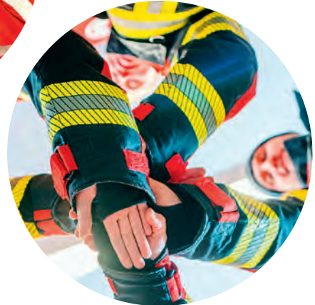
Der LandesFeuerwehrVerband Bayern e.V. hilft mit dem Sonderkonto „Hilfe für Helfer“ zahlreichen Feuerwehrangehörigen, die bei Einsätzen verletzt oder getötet wurden, und ihren Familien schnell und unbürokratisch.