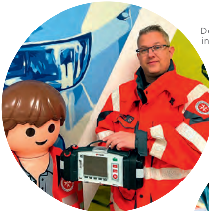
Der Regionalverband Oberbayern der Johanniter investiert die 21.000,- Euro Spende der Sparda-Bank München in ein Wasser-Modul, das zur Unterstützung der Feuerwehr bei Hochwassereinsätzen oder auch Waldbränden genutzt werden kann, und ein EKG-Modul für das Utility Vehicle (UTV) der Unterstützungsgruppe Schweres Gelände.