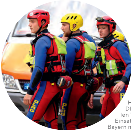
Helferinnen und Helfer der DLRG Bayern mit einer speziellen Wasserretter-Ausrüstung im Einsatz. Die DLRG will überall in Bayern mit Gliederungen aktiv sein, um die Einsatzgebiete so effizient wie möglich zu verteilen. Nur so kann sie im Ernstfall schnell mit ihren Helferinnen und Helfern vor Ort sein.